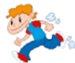
run - fut