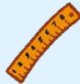
ruler - vonalzó