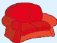
sofa - dívány