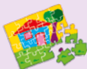
puzzle (kép)kirakós játék