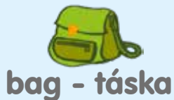
bag - táska