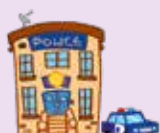
police station rendőrség