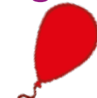
ballon - léggömb