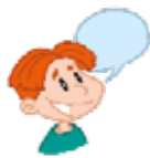
talk - beszél