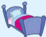
bed - ágy