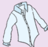
shirt - ing