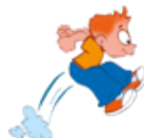
jump - ugrik