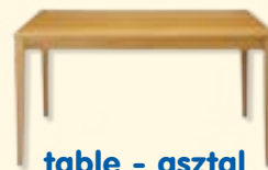
table - asztal