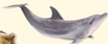
dolphin - delfin