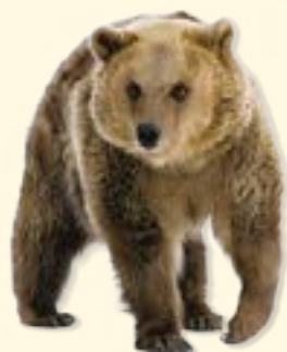
bear - medve