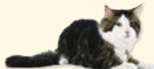
cat - macska