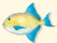
fish - hal