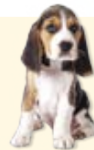
dog - kutya