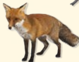
fox - róka