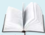
book - könyv