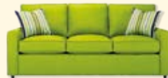
sofa - kanapé