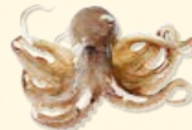
octopus - polip