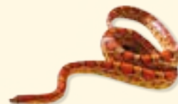
snake - kígyó