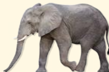
elephant - elefánt