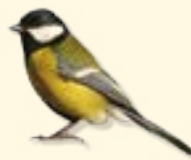
bird - madár