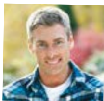
dad - apa