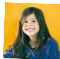
sister - lánytestvér