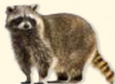
raccoon - mosómedve