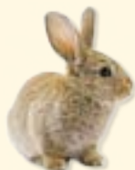
rabbit - nyúl