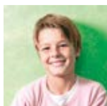
brother - fiútestvér